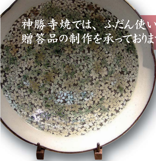
大皿 ¥50,000 ~