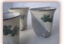
湯のみ ¥1,500 ~