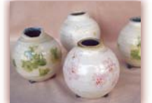
一輪差 ¥1,000 ~