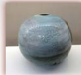
小壺 ¥2,800 ~