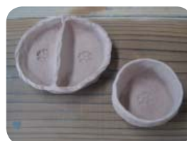
工房で乾燥後素焼き