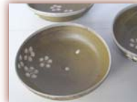
浅鉢 ¥3,500 ~