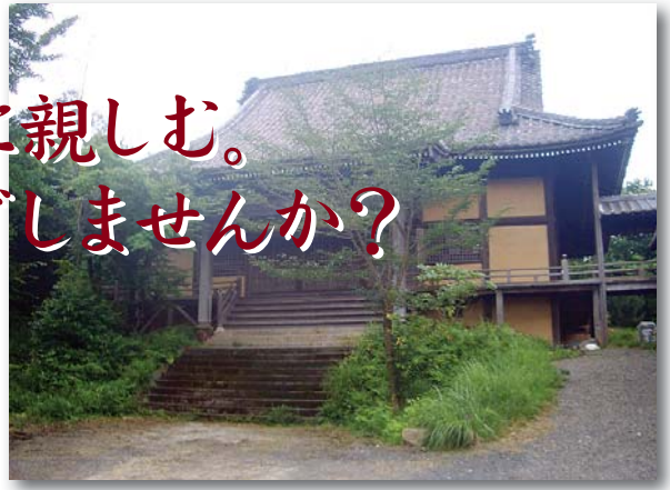
廃寺を利用した工房