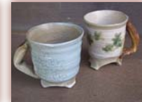
マグカップ ¥3,000 ~