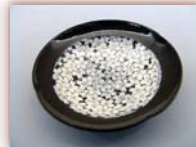
菓子器 ¥10,000 ~