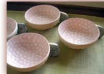
菓子器 ¥4,000 ~