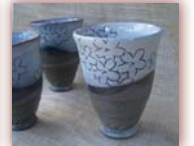
フーカップ ¥3,000 ~