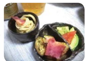
釉掛け後、本焼きして完成