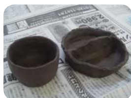
ひも作り(手びねり)