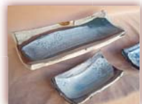
長皿 ¥1,000 ~