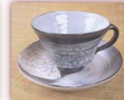
コーヒーカップ ¥4,000 ~