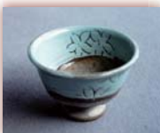
ぐい呑 各種 ¥1,000 ~